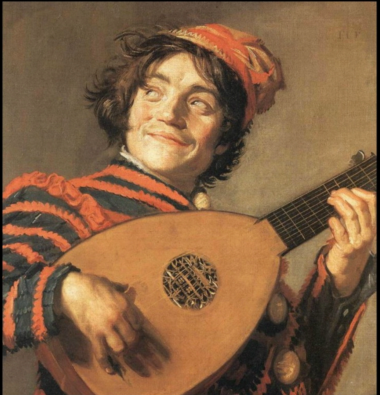
Frans HALS - bouffon jouant du luth (1623)