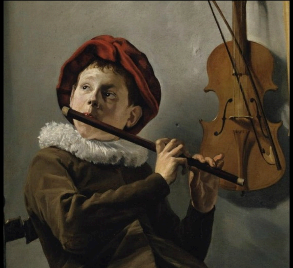
Judith LEYSTER - jeune joueur de flute (1635)