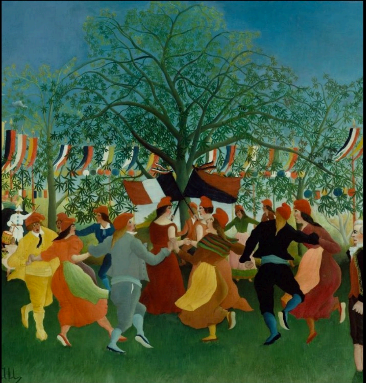
le douanier ROUSSEAU - fête de l'indépendance