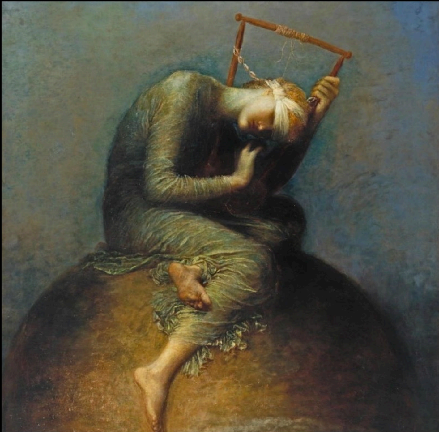
George Frederic WATTS - Hope (1885)

Face aux ténèbres J'ai dressé des clartés Planté des flambeaux A la lisière des nuits