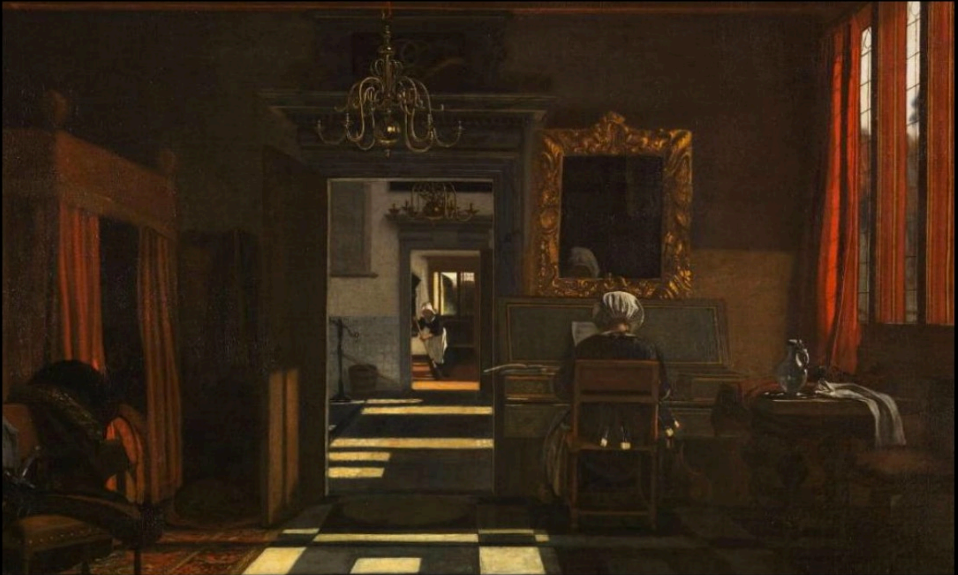
Emmanuel de WITTE - interieur hollandais