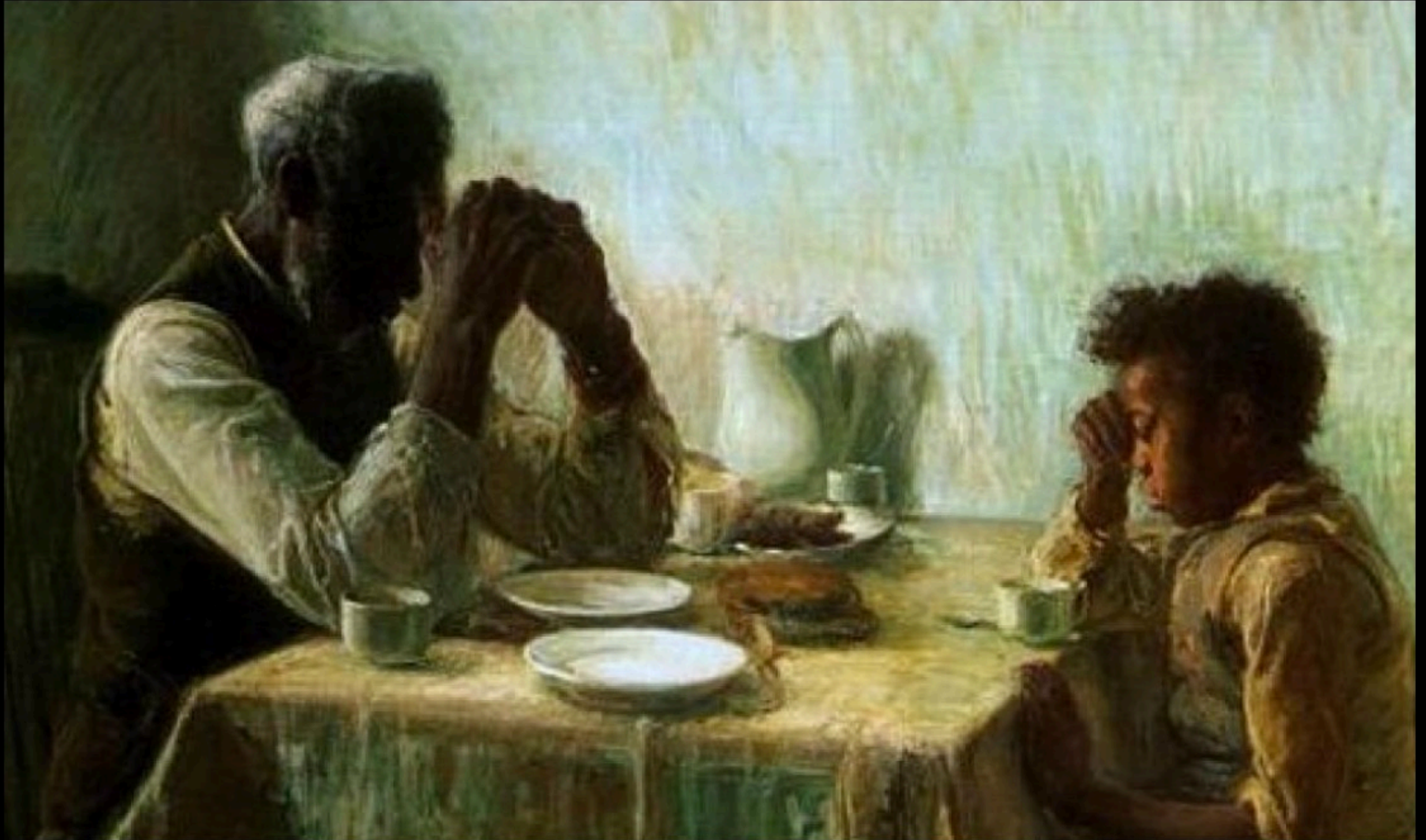
Henry Ossawa TANNER - le benedicté

Leopold Sedar Senghor - Prière d'un petit enfant nègre