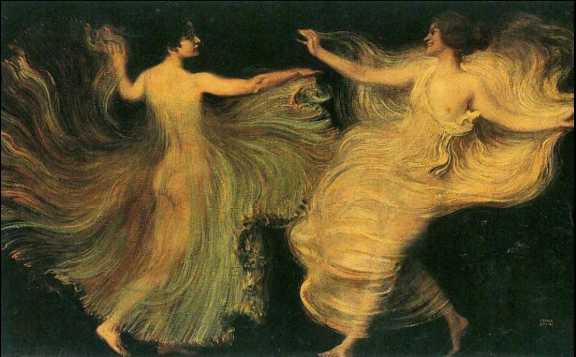
Franz von STUCK - Deux danseuses