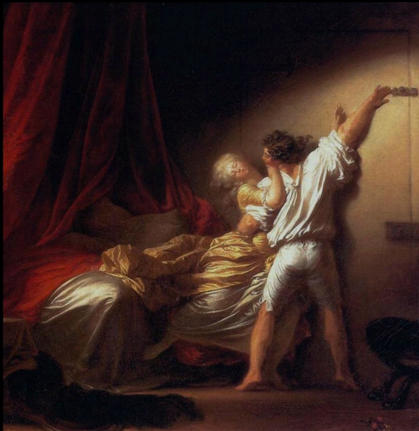
Jean-Honoré FRAGONARD - le verrou (1775)