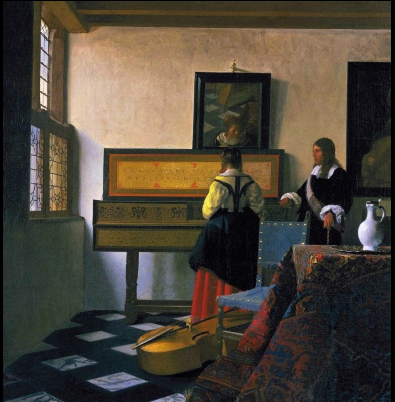
Johannes VERMEER - la leçon de musique (1662)