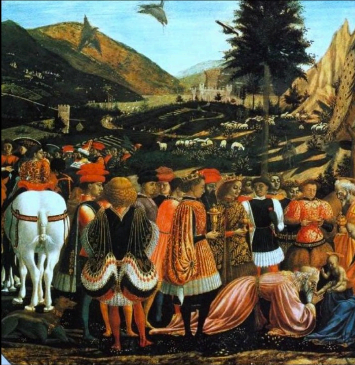
Domenico VENEZIANO - l'adoration des Mages (1439)

Chargés de nefs d'argent, de vermeil et d'émaux Et suivis d'un très long cortège de chameaux, S'avancent, tels qu'ils sont dans les vieilles images De l'Orient lointain, ils portent leurs hommages