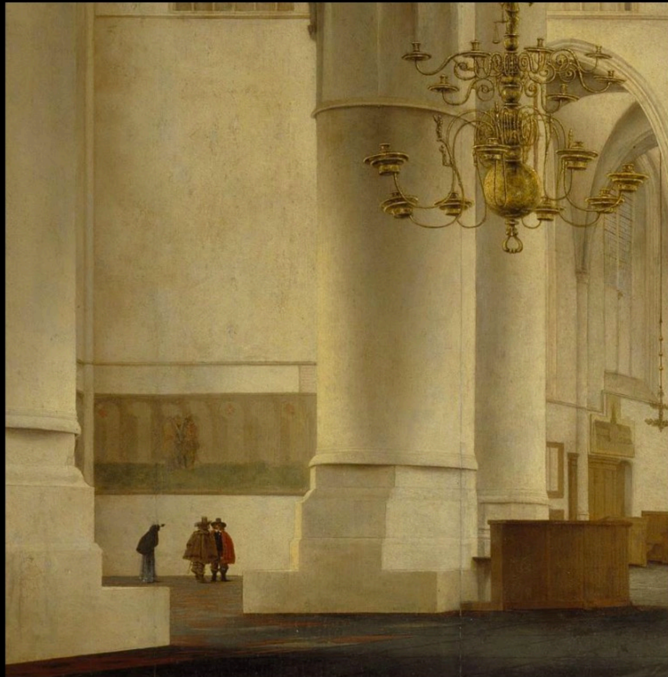
Pieter Jansz SAENREDAM - intérieur de l'église St Bavo à Haarlem (1648)