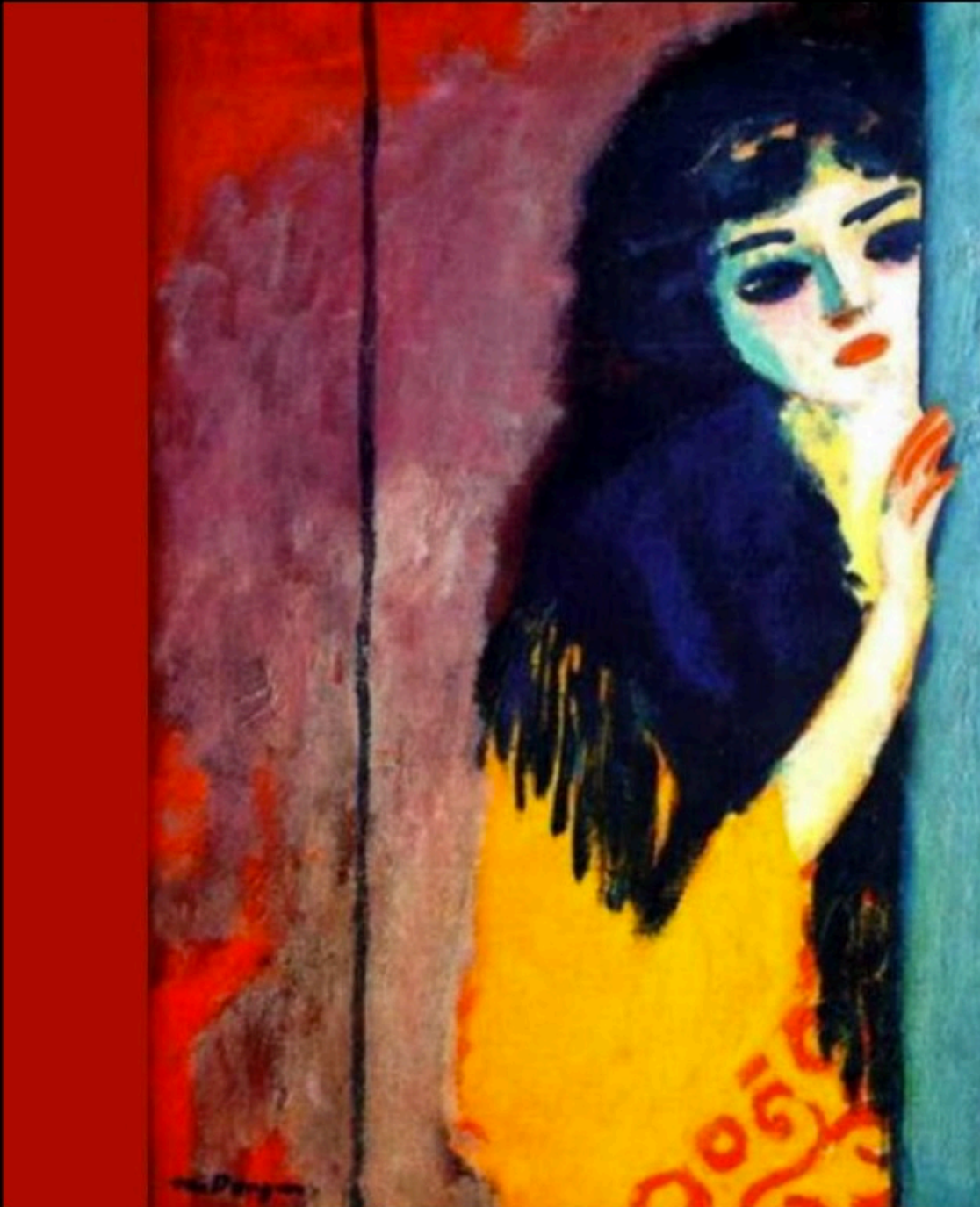
Kees Van DONGEN - gypsy

Ses yeux charbons ardents Etaient devenus mes aurores Ce doux enfer Ce paradis infernal Le cliquetis de ses bracelets Etait cloche de cathédrale Ses mouvements Des marais d'océan