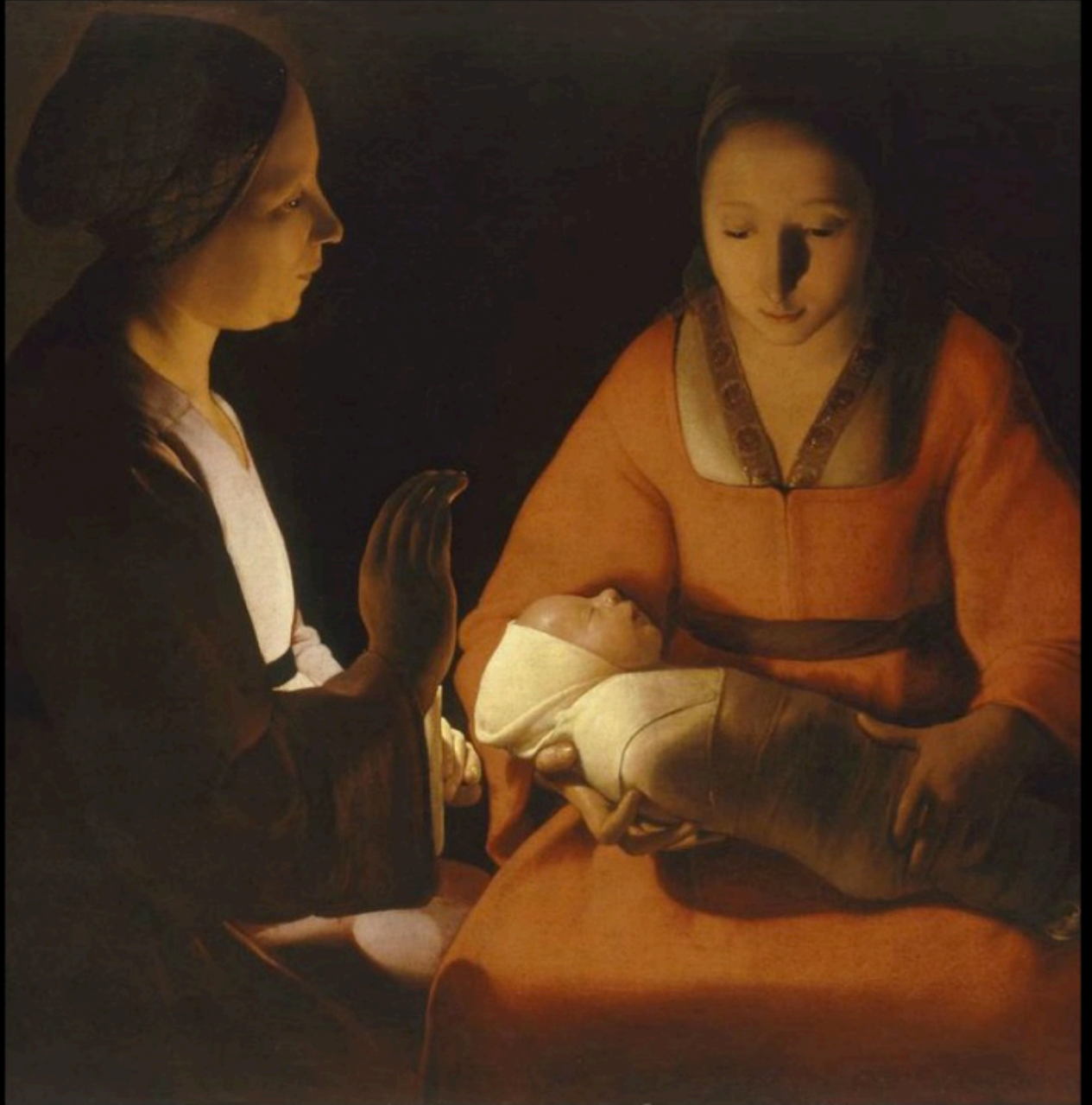
Georges de la TOUR - nativité (1645)