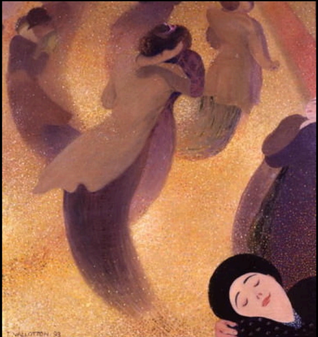
Felix VALLOTTON - la valse (1893)