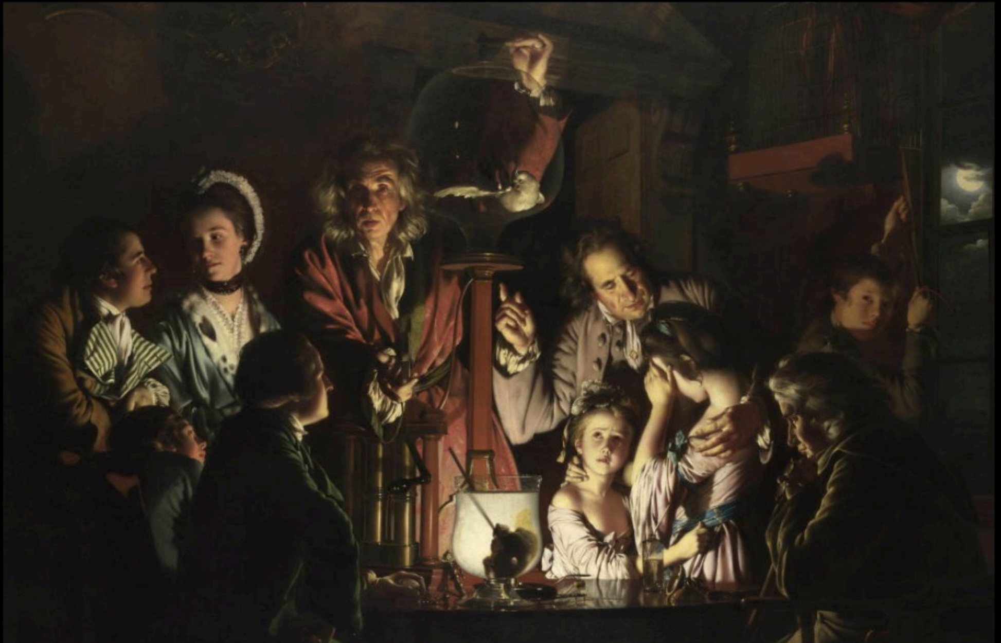
Joseph WRIGHT of Derby - experience avec une pompe à air sur un oiseau (1768)