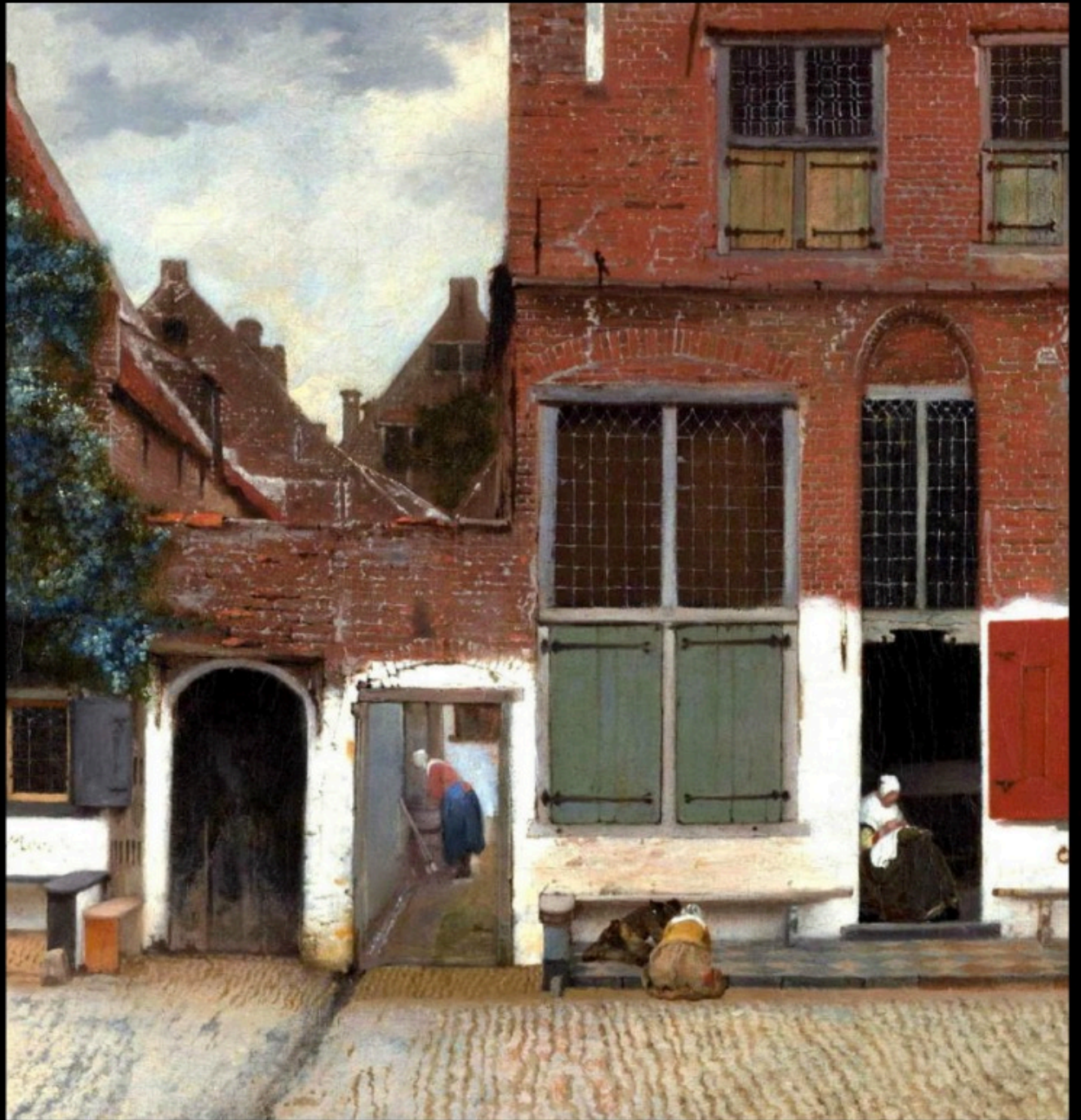
Johannes VERMEER - la ruelle

Marceline Desbordes-Valmore Une ruelle de Flandre