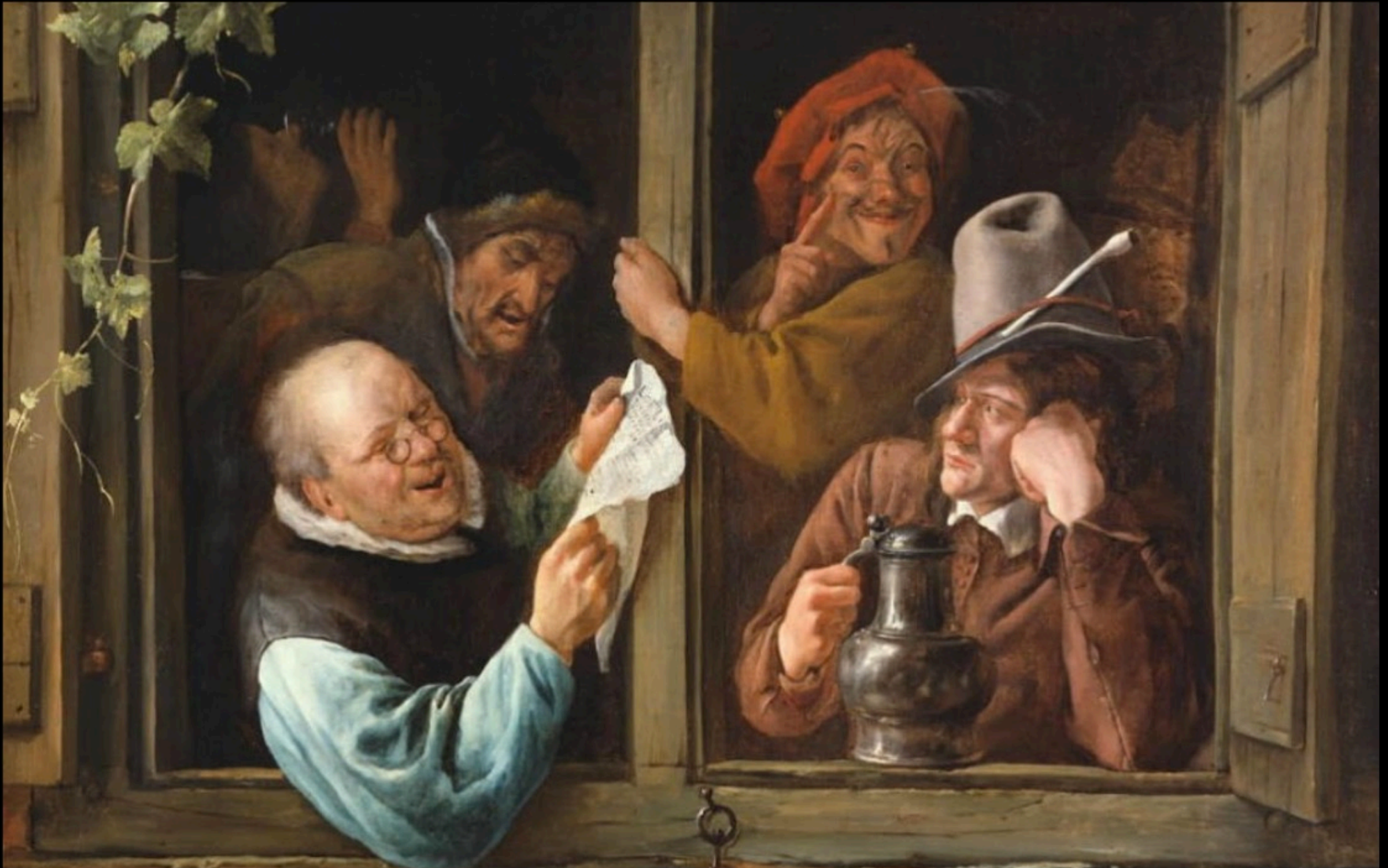
Jan STEEN - rethoriciens à la fenetre (1662)