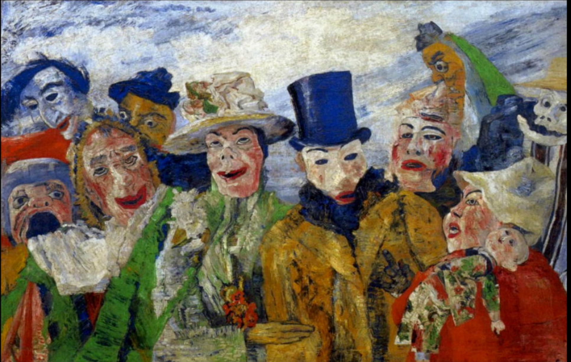
James ENSOR - l'intrigue (1890)