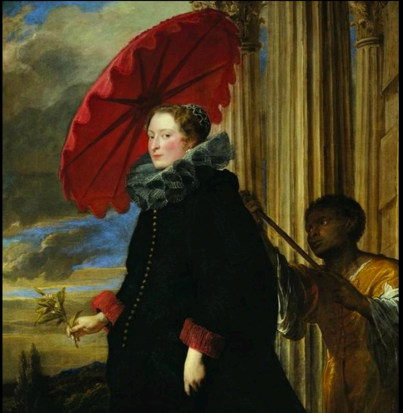
Anton van DYCK - Marchesa Elena Grimaldi (1623)