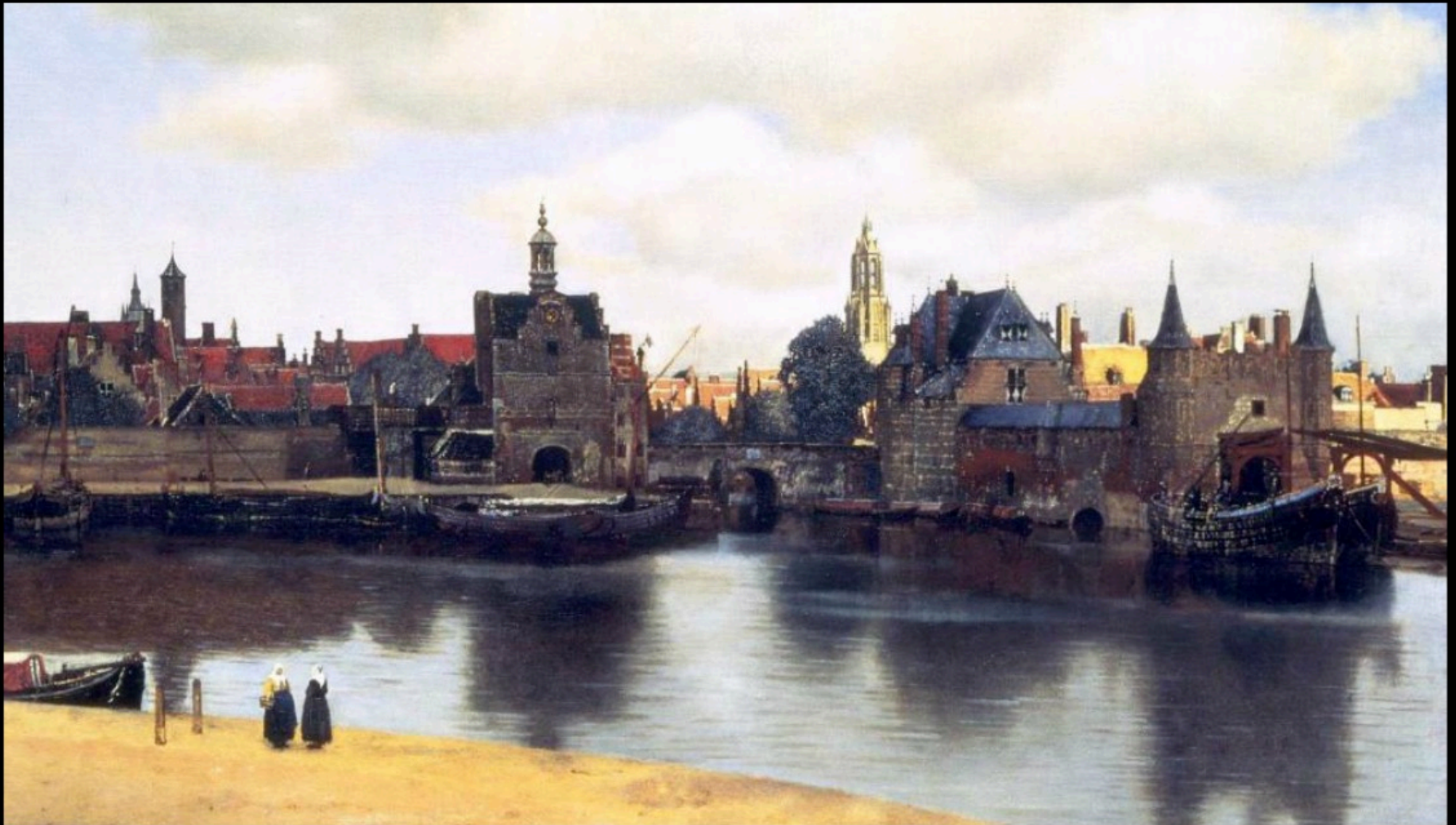
Johannes VERMEER - vue de Delft (1659)