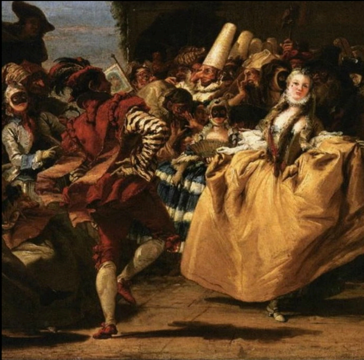
Giandomenico TIEPOLO - scene de carnaval (1753)

Venise pour le bal s'habille. De paillettes tout étoilé, Scintille, fourmille et babille Le carnaval bariolé