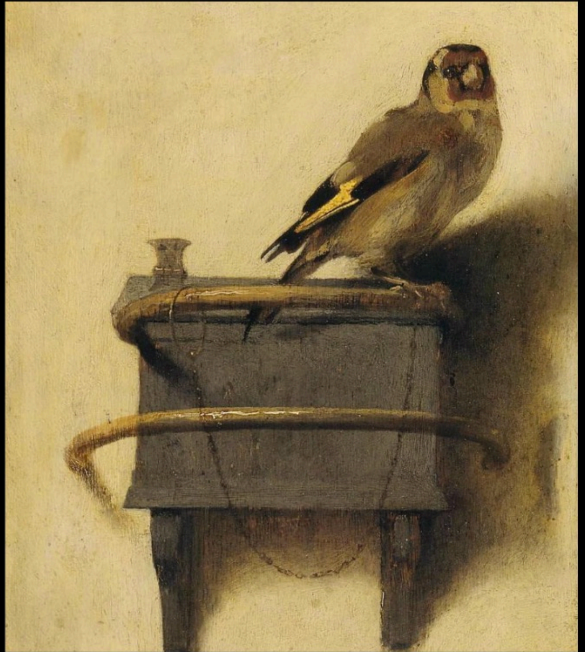
Carel FABRITIUS - le chardonneret (The Goldfinch) (1654)

Jean-Pierre Claris de Florian Les Serins et le Chardonneret