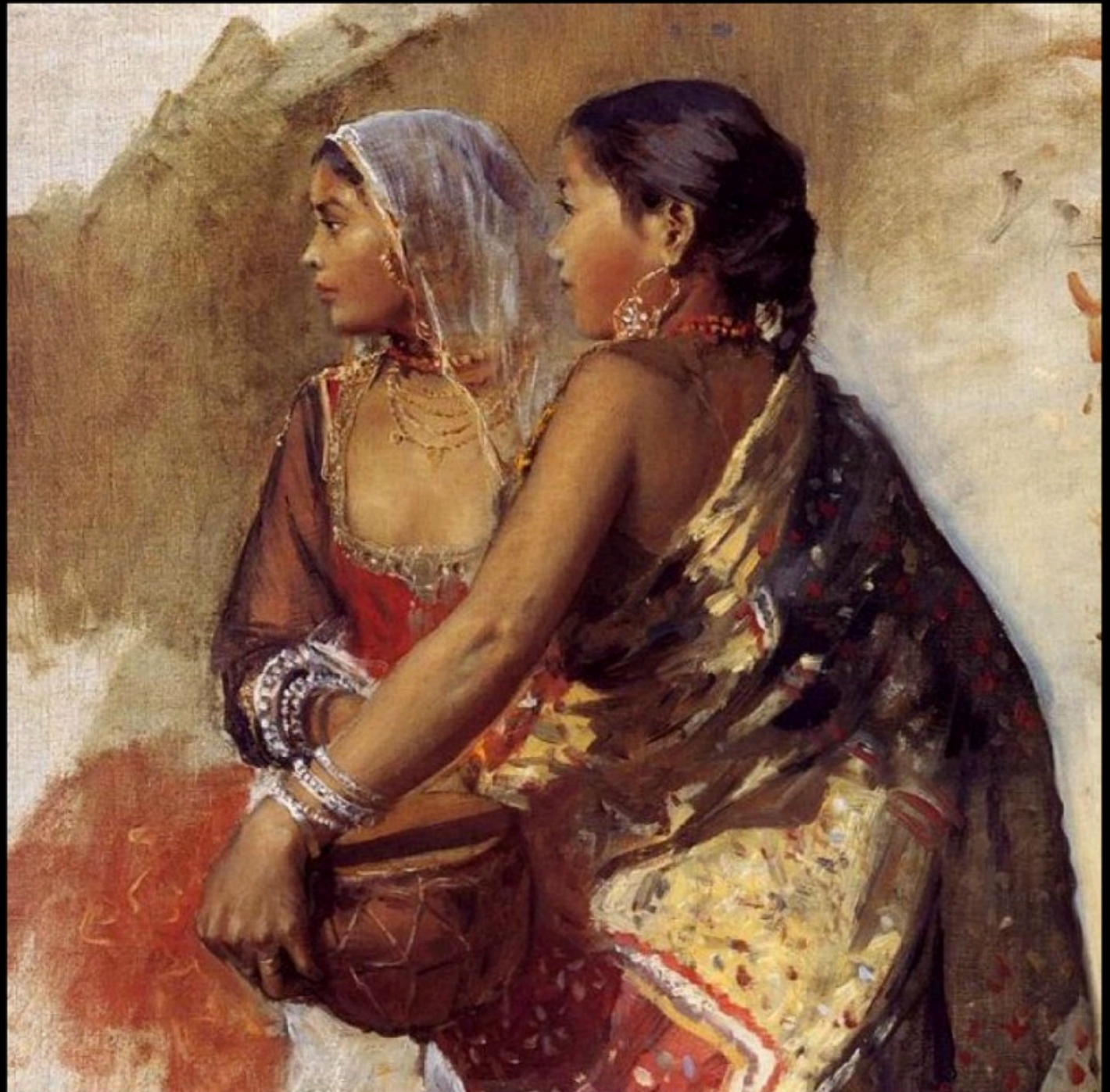
Edwin Lord WEEKS - Sketch - Two Nautch Girls (1900)