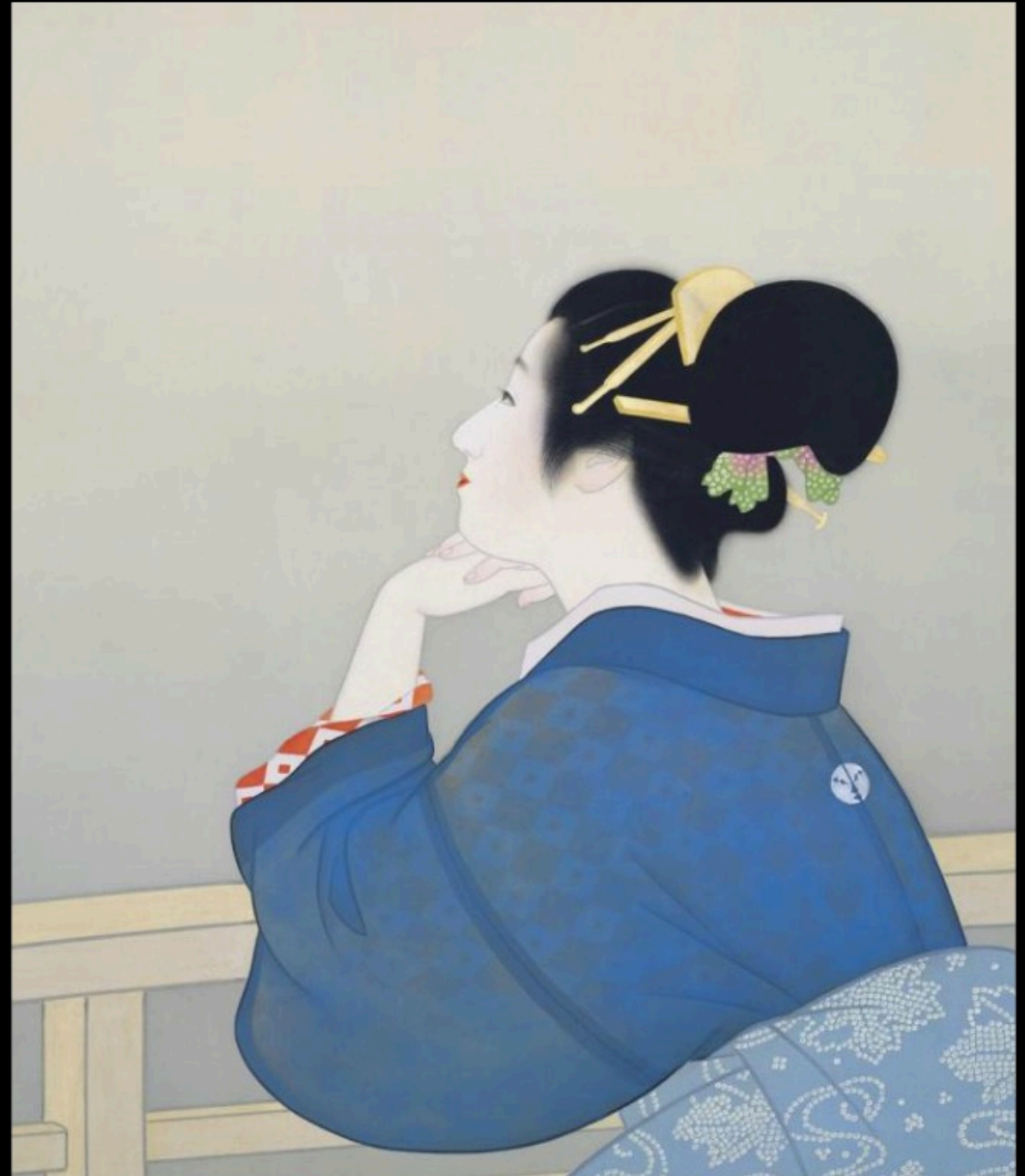
Uemura SHOEN - femme attendant la levée de la lune (1944)