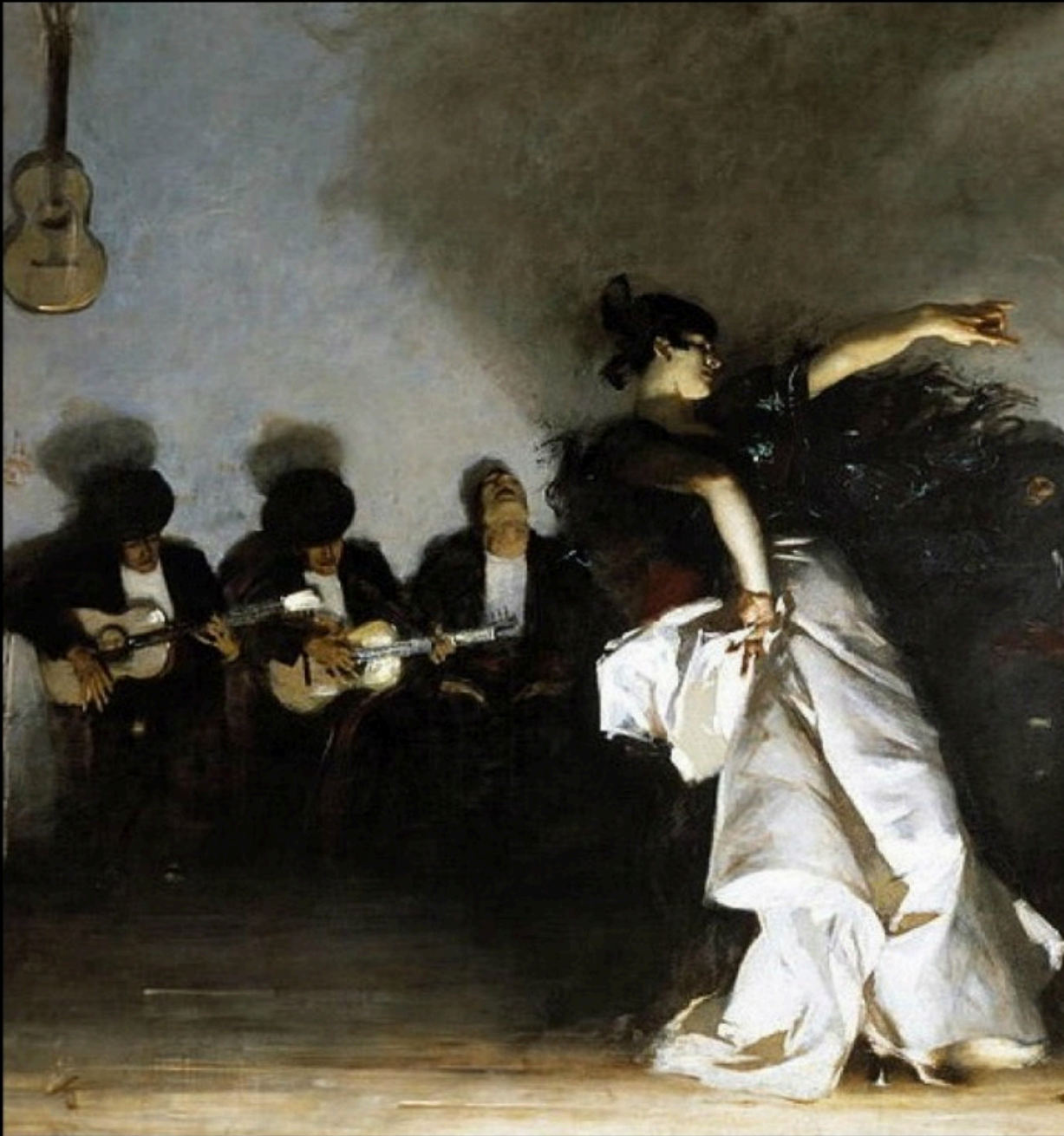
John Singer SARGENT - el Jaleo

Elle danse la vie qui circule et bouillonne A chaque mouvement rouge comme son sang