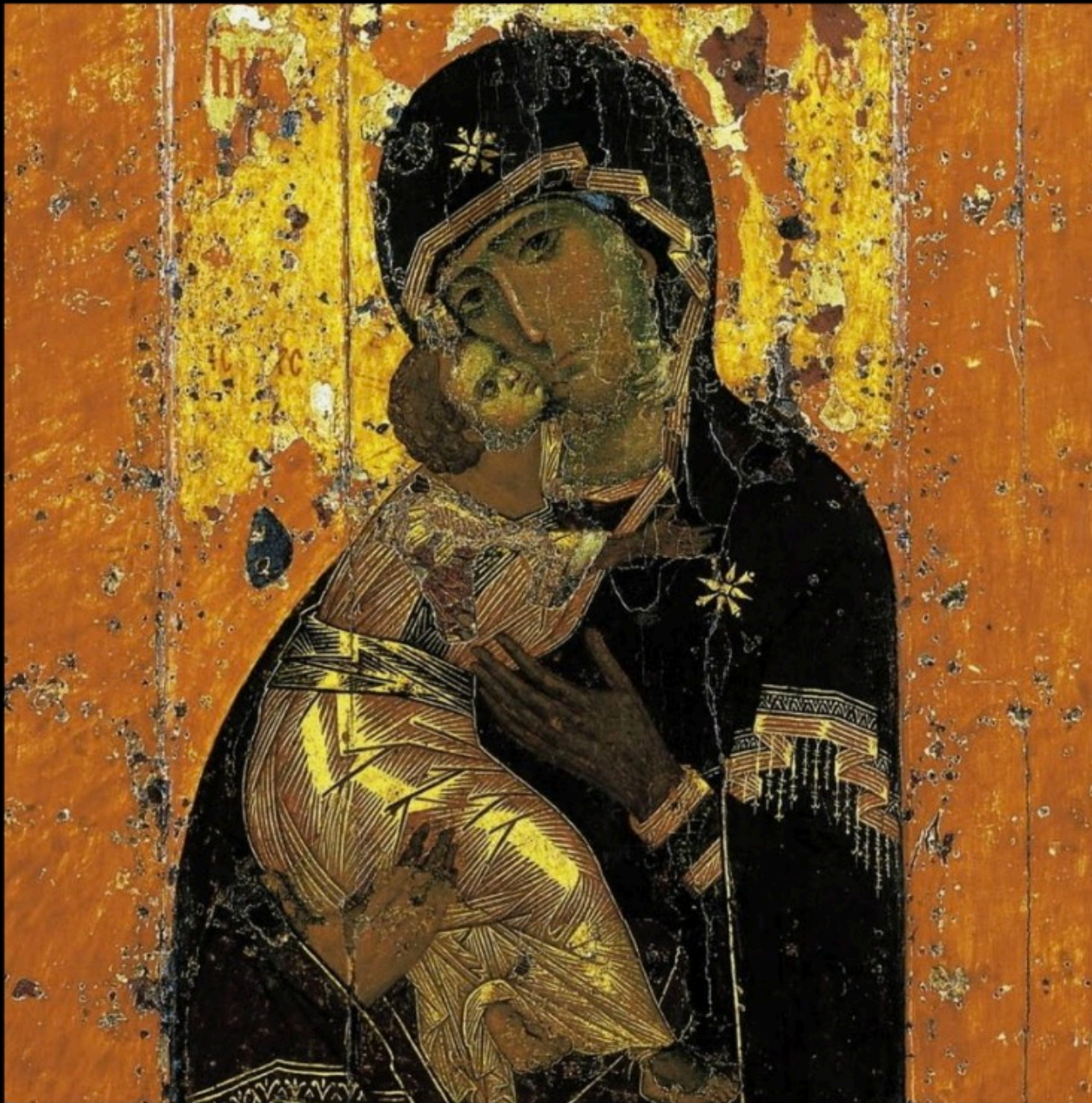
Vierge de Vladimir (1131)

Infiniment humble infiniment jeune. infiniment mère.