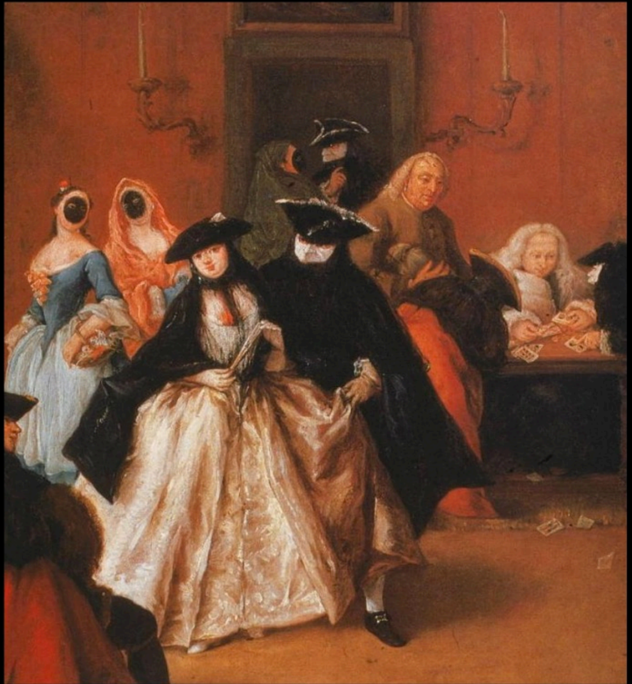
Pietro LONGHI - ridotto (1750)