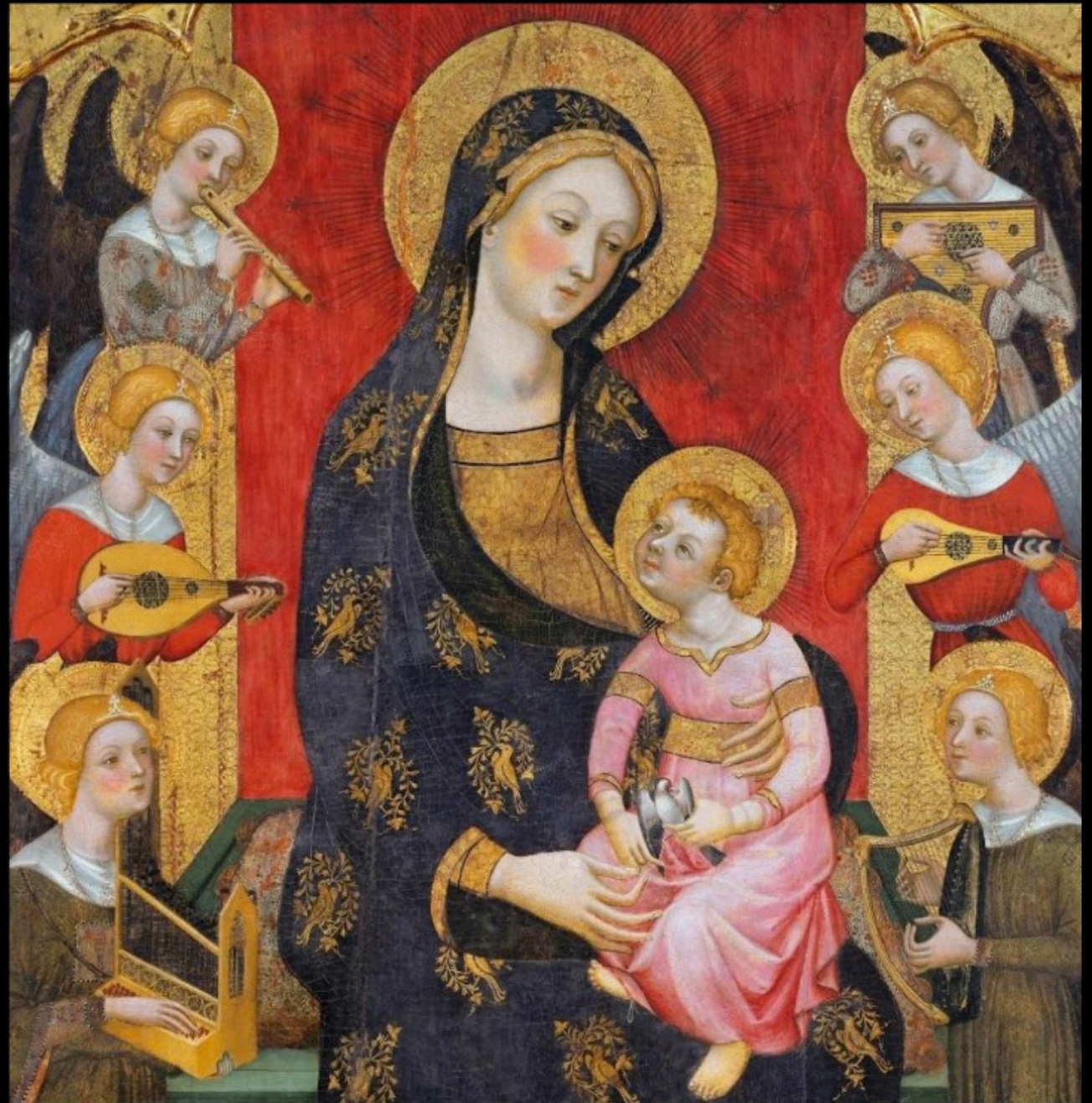
Pere SERRA - Vierge entourée d'anges (1375)