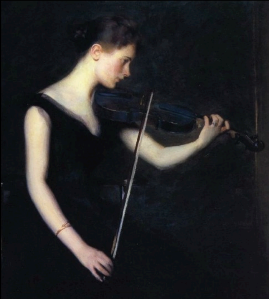
Edmund TARBELL - jeune fille au violon

Quand sa lèvre aux souffles musicaux Éveille les chansons au creux de mon silence, Je tressaille, je vibre, et la note s'élance Le chapelet des sons va s'égrenant dans l'air