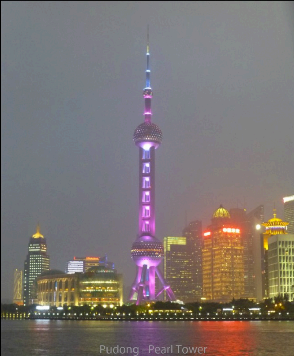
Pudong - Pearl Tower

Le sage est dragon à l'extérieur et phénix à l'intérieur