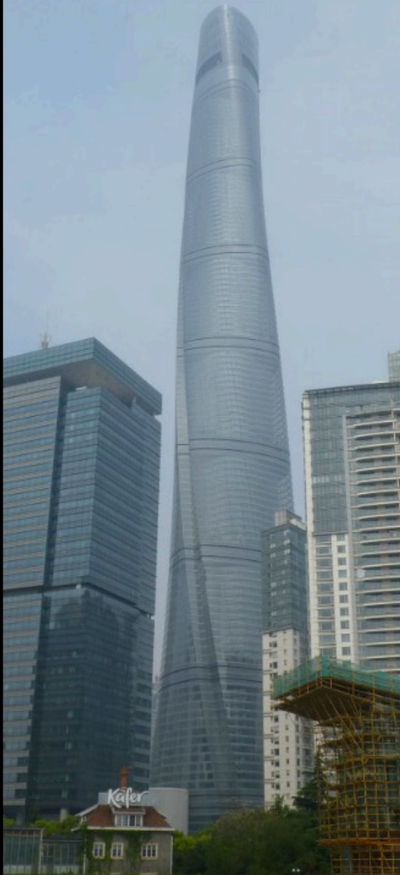
Tour Shanghai 632m