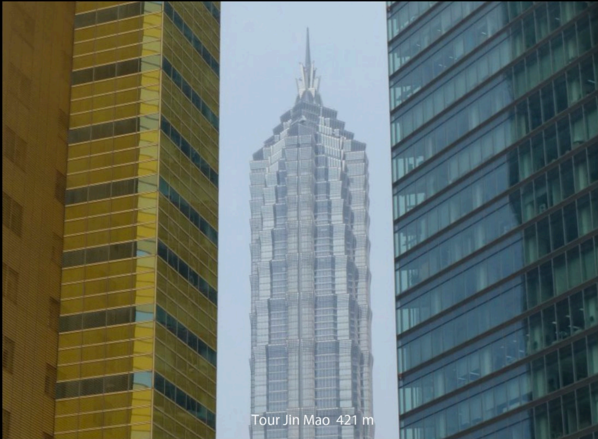
Tour Jin Mao 421 m