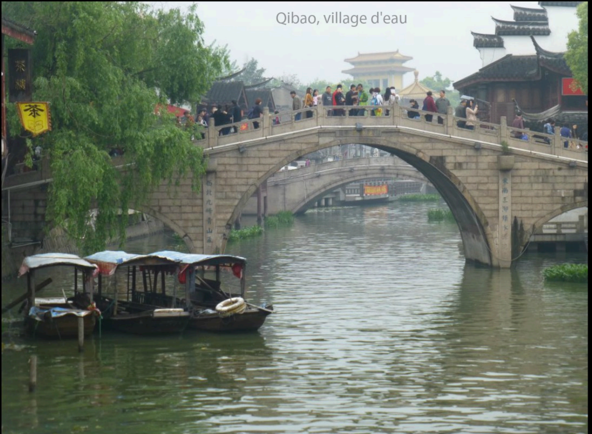
Qibao, village d'eau