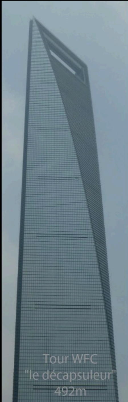
Tour WFC "le décapsuleur" 492m

Dépasser le but, ce n'est pas l'atteindre