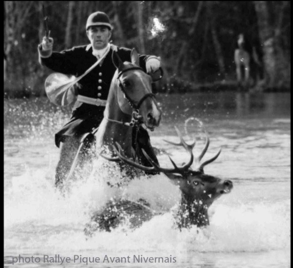
photo Rallye Pique Avant Nivernais