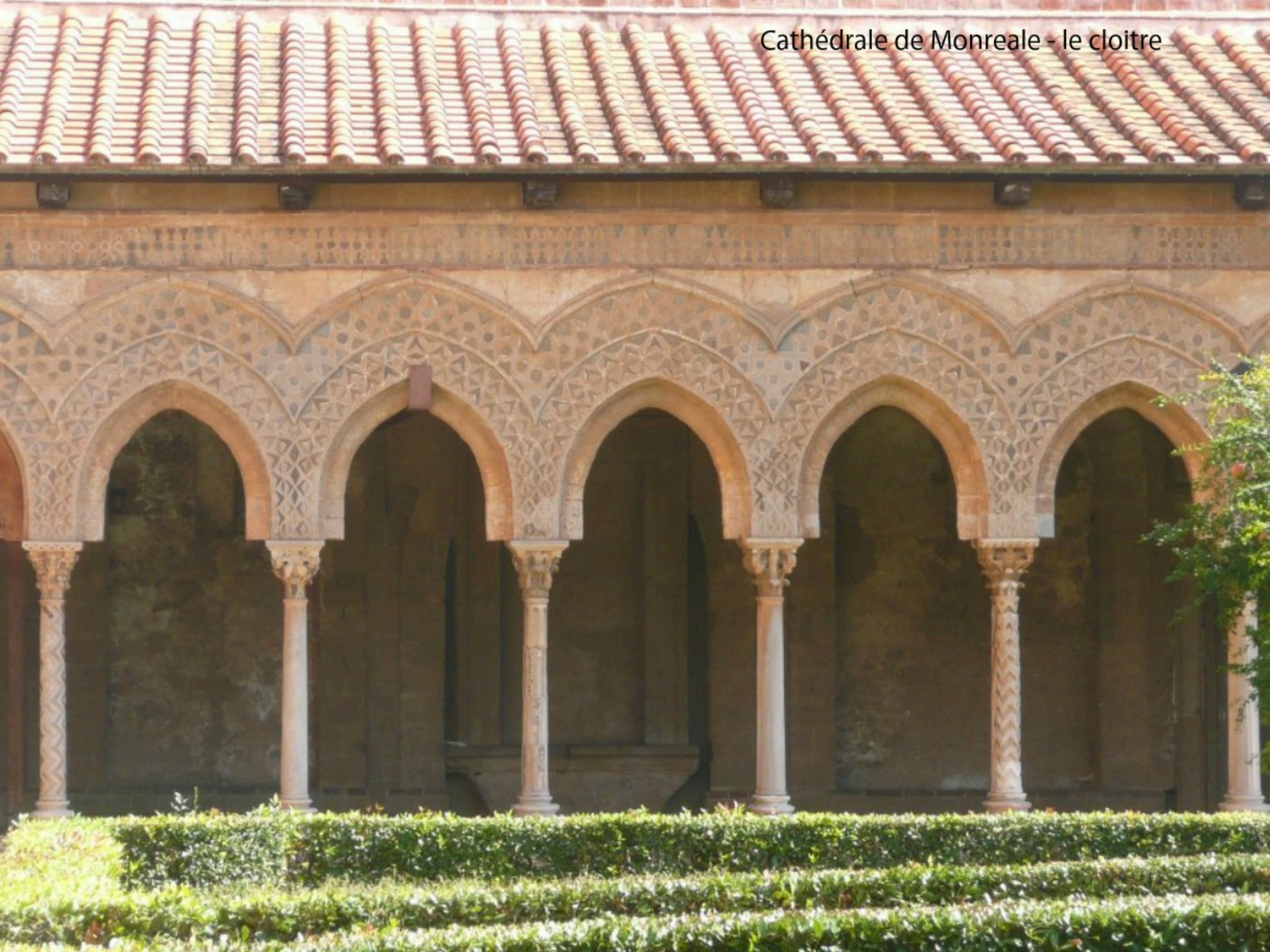
Cathédrale de Monreale - le cloître