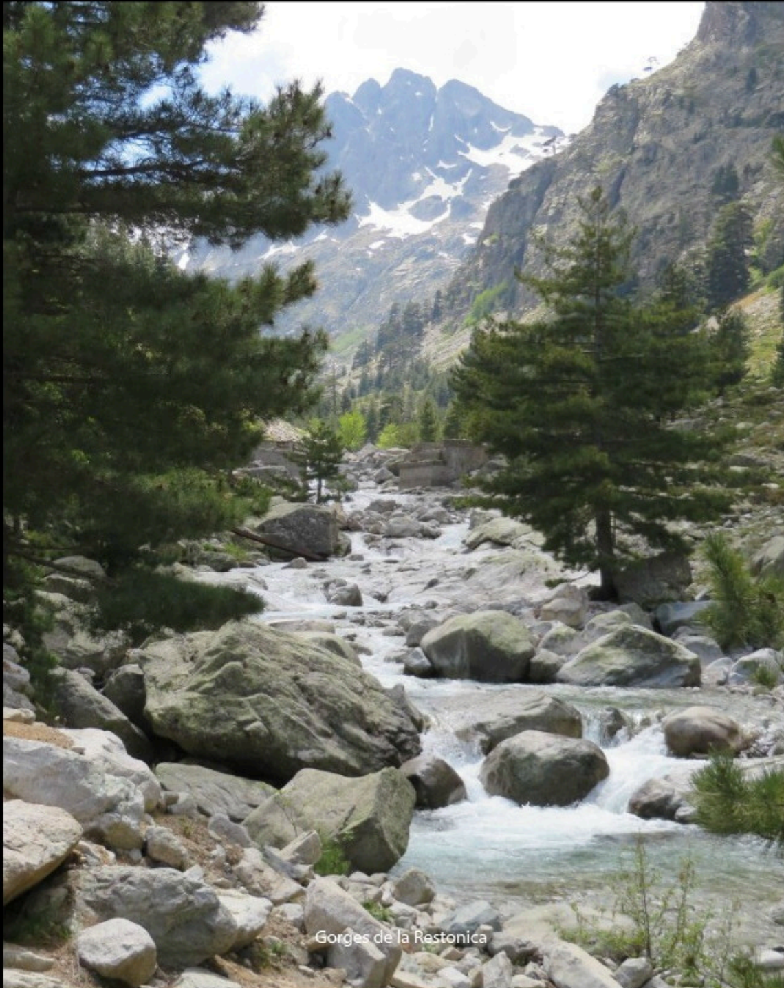
Gorges de la Restonica

O mon frère chercheur d'eau lorsque tremble ta baguette et nerveuse se redresse l'eau s'ouvre un chemin dans le sureau pour le jaillissement. Alors je creuse pour donner forme à ton désir.